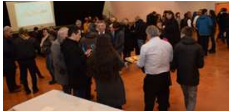
Beaucoup de monde lors de cette cérémonie des vœux aux villageois.

Le plan local d'urbanisme est en cours d'élaboration avec l'obligation de respecter les mesures imposées par l'État, celles-ci concernant la réduction de la consommation des espaces agricoles. Dans ce cadre, le maire invite ses administrés à suivre rigoureusement les infor-