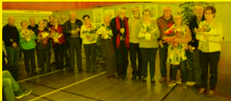
Les couples ayant 50 ans de mariage en 2019.

Dans la salle des sports, plus de 200 personnes ont répondu à l'invitation du CCAS qui organise chaque année le traditionnel goûter réservé aux plus de 65 ans.