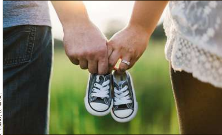
En France, entre 18 et 24 % des couples rencontrent un problème d'infertilité.