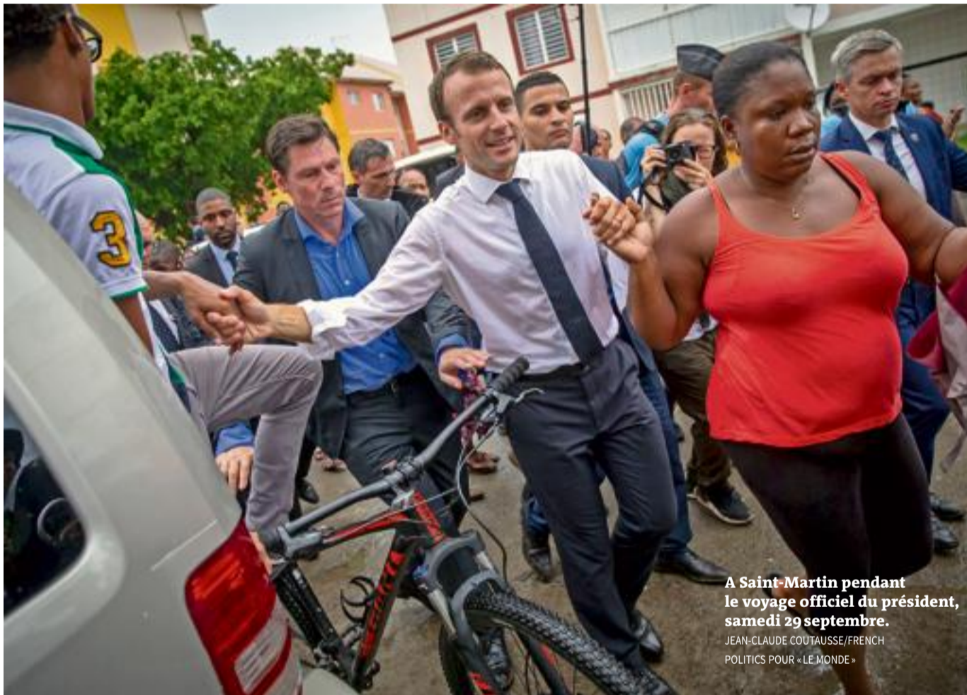
A Saint-Martin pendant le voyage officiel du président, samedi 29 septembre.