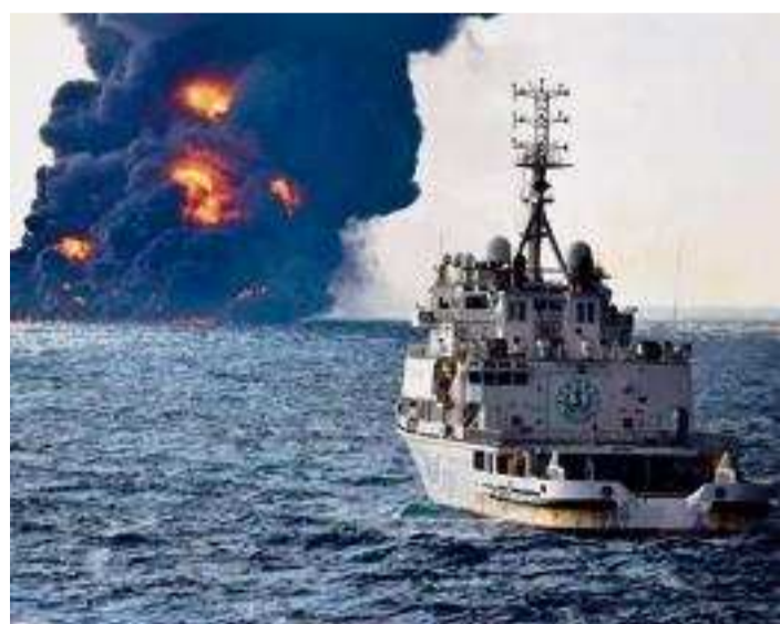
L'incendie du tanker iranien « Sanchi » en mer de Chine, le 14 janvier.

Après le naufrage au large de Shanghai du Sanchi , un pétrolier iranien transportant 136 000 tonnes d'hydrocarbure, qui a fait 3 morts et 29 disparus parmi l'équipage, des nappes menacent les côtes. Même si le condensat qui s'échappe des soutes s'avère plus volatil que du pétrole brut et